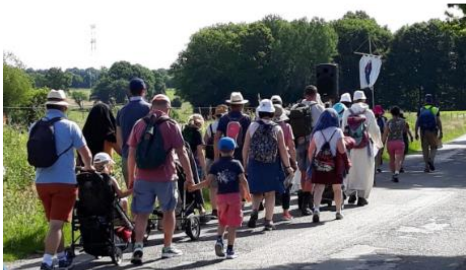
Pèlerins vers Pontmain