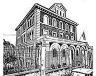
Scuola Sant Ivo - Roma