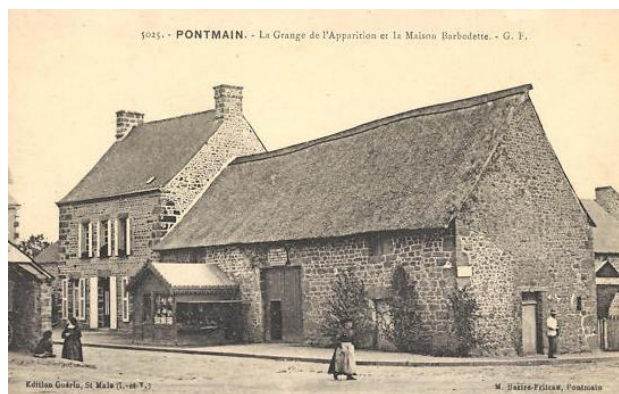
Pontmain, La Grange de l'Apparition et la Maison Barbedette