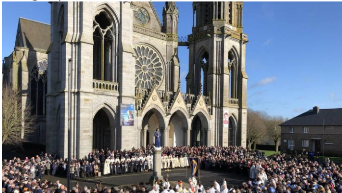
Pontmain. Autour de la Vierge, une ferveur intacte