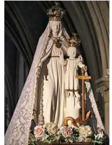
Notre Dame de l'Espérance à St Brieuc