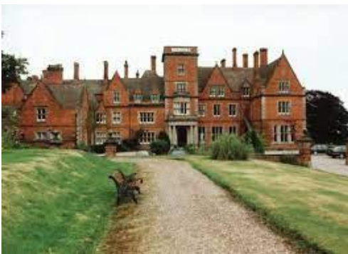
Noviciat de Cheswardine

Trois semaines se sont écoulées depuis ce changement ; la malade, retournée chez elle, ne ressent aucune douleur ; elle se nourrit comme avant sa maladie et semble en parfaite santé. Elle est venue à notre