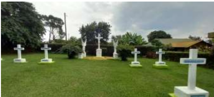
Cimetière des Frères à Mount St Teresa