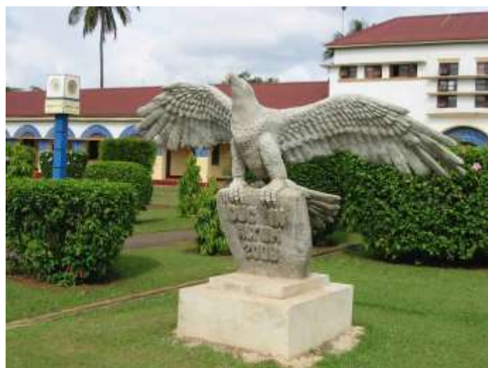
Monument "Duc in Altum" at St Mary's Kisubi