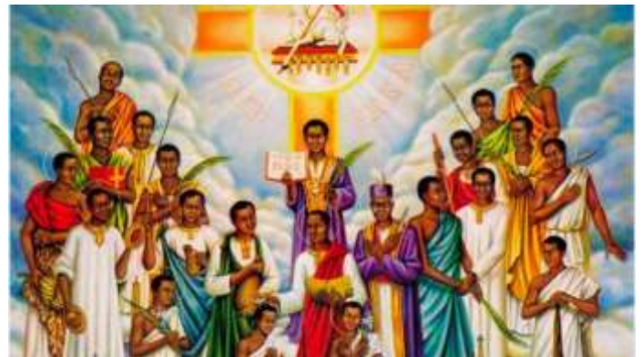
Martyrs of Uganda

Dans le Royaume des Baganda et populations limitrophes, sous le protectorat anglais, les Pères Blancs (Missionnaires d'Afrique) et d'autres évangélistes avaient commencé à annoncer la foi chrétienne. En peu d'années l'évangile s'était rapidement répandu. Le christianisme avait touché profondément les cœurs des populations, particulièrement des jeunes attirés par la personne et le message de Jésus. Pour arrêter les conversions chrétiennes, rois et autorités religieuses du lieu, commencèrent à persécuter durement les