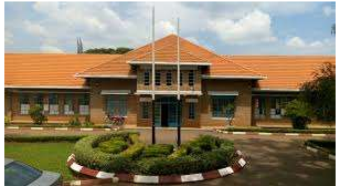
St Henry's College - Kitovu