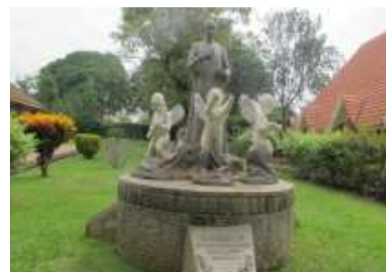
Monument at Kitovu, Bro Charles-Jules Poitras, the Founder

A travers les vagues des nouveaux contingents de Frères surtout canadiens, les champs d'apostolat se