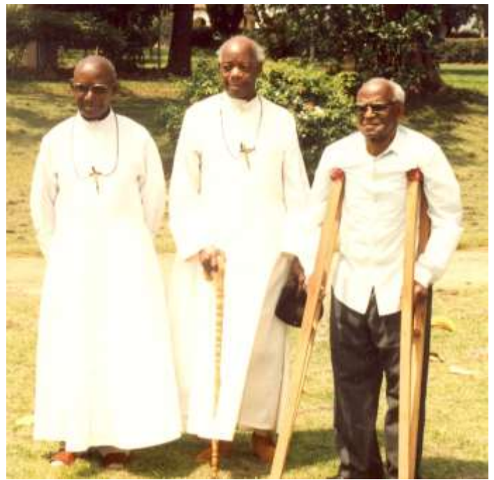
Les 3 Frères pionniers, lors de leurs 60 ans de vie religieuse

développement apostolique, il prenait part à la joie de ses Frères, après avoir partagé leur labeur, oubliant près d'eux les soucis de l'administration".