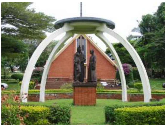
Monument of the Founders at Mount Saint Teresa, Kisubi