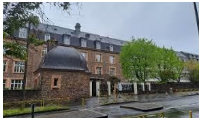
El Colegio Asunción en Rennes, hoy